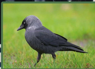
Choucas des tours